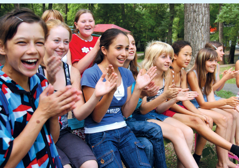
Ежегодно организованным отдыхом охвачено более 200 тысяч детей