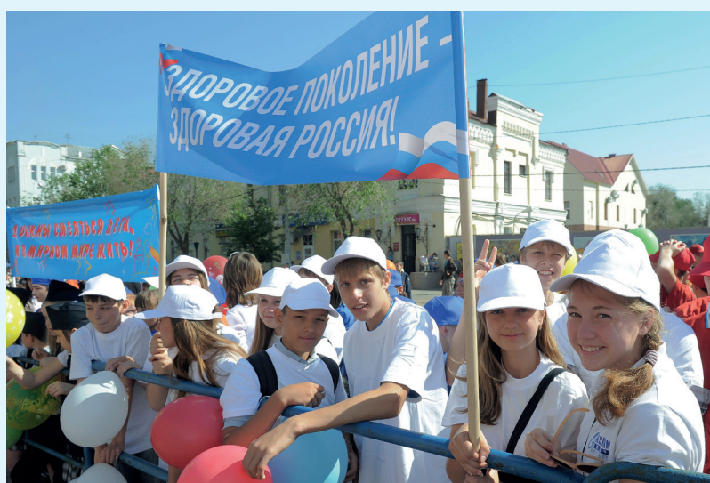
В Оренбуржье в 20-й раз прошел областной День детства