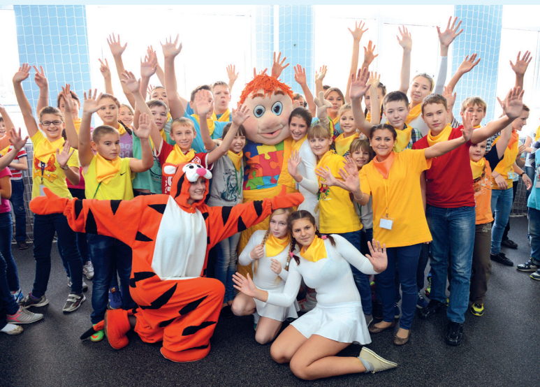
В Тюльганском районе состоялось торжественное открытие круглогодичного оздоровительно-образовательного детского центра «Солнечная страна».