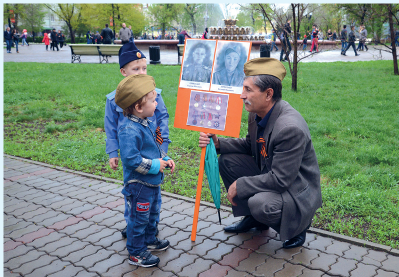
Юные оренбуржцы приняли участие в мероприятиях в честь Дня Победы: акции «Читаем детям о войне» и шествии «Бессмертного полка».